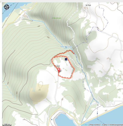
A la découverte de 20 espèces de plantes endémiques (Tourisme en Aubrac)

Un sentier à la découverte de la flore endémique de la Viadène. Et un superbe point de vue suspendu au-dessus de la cascade du saut du chien.