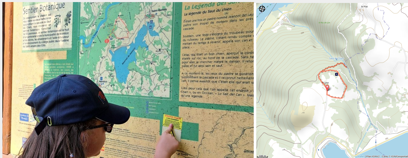
A la découverte de 20 espèces de plantes endémiques (Tourisme en Aubrac)

Un sentier à la découverte de la flore endémique de la Viadène. Et un superbe point de vue suspendu au-dessus de la cascade du saut du chien.