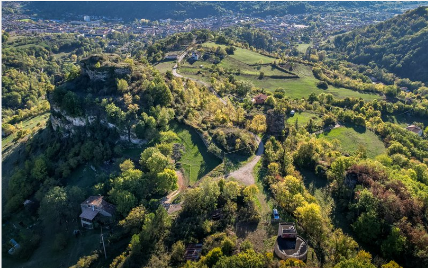
Panorama sur Saint-Affrique (Virginie Govignon)