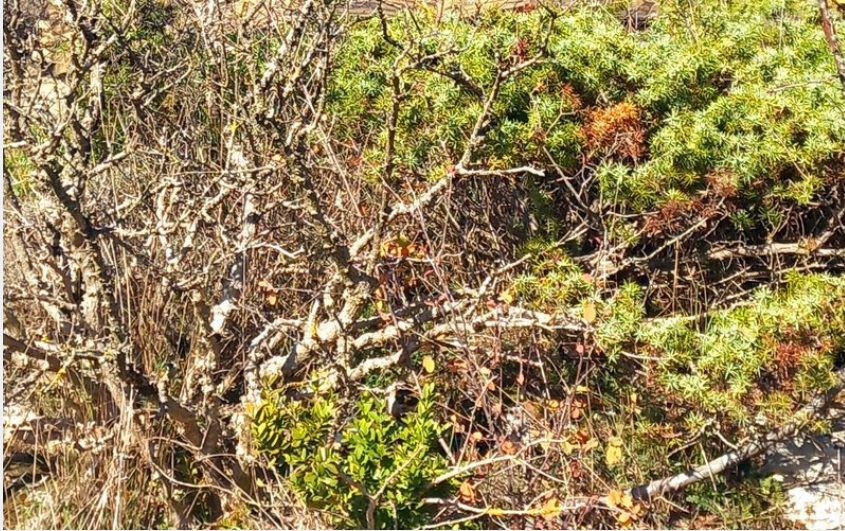
observatoire (P Gasnault CCLL)