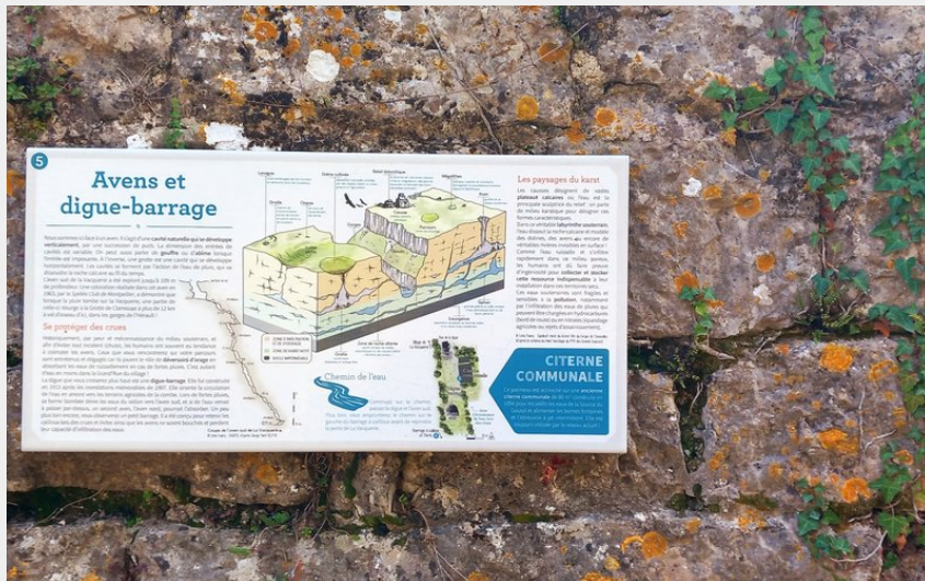
panneau (P Gasnault CCLL)