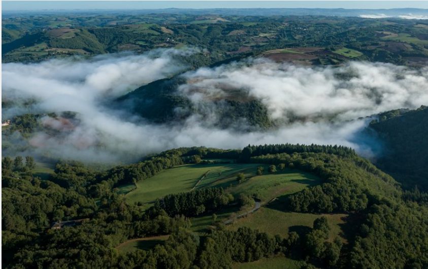
Panorama des vallons (Xavier Waerzeggers)