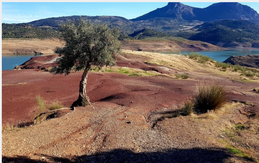
salagou en hiver (Séverine Roques - CCLL)