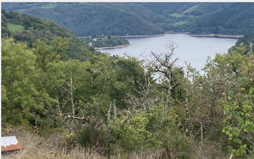
La montée sur le plateau de Jongues réserve une belle surprise (Tourisme en Aubrac)