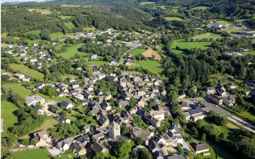
Photo aérienne d'Agén d'Aveyron