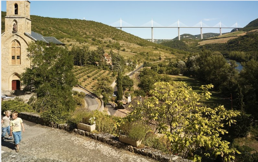
Vue depuis le Village de Peyre