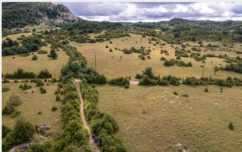
Paysage du Larzac (Virginie Govignon - OT Larzac et Vallées)