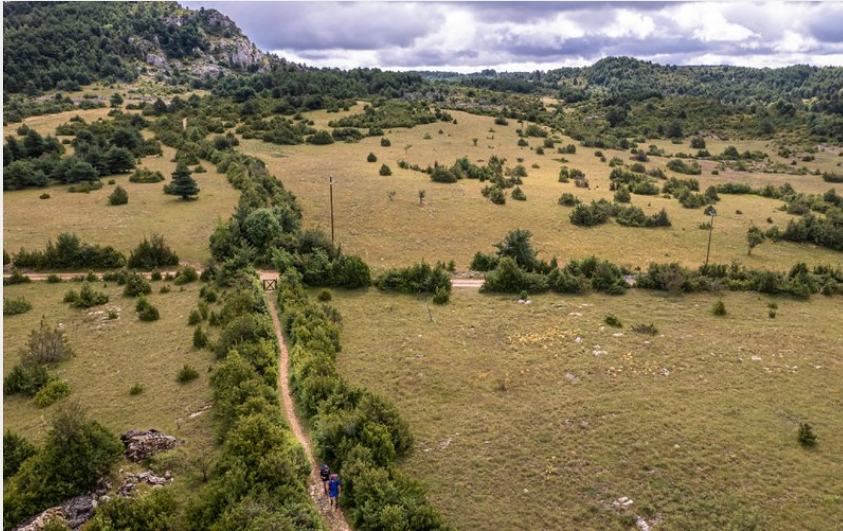
Paysage du Larzac