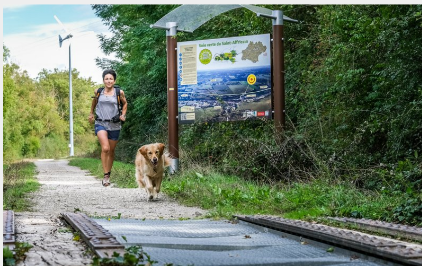
Voie Verte (Virginie Govignon)