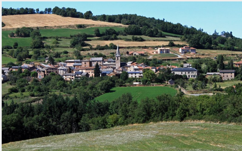
Village de Pousthomy (FNirpot)