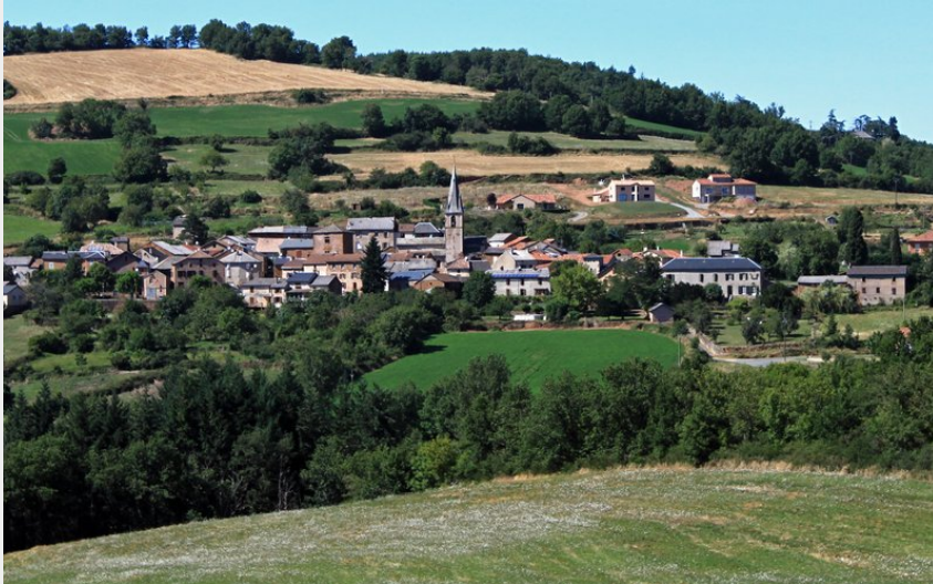
Village de Pousthomy (FNirpot)