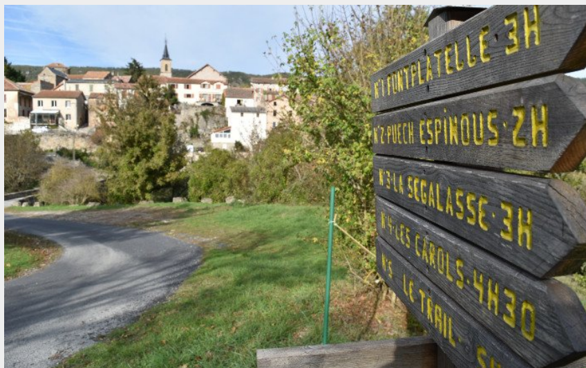
Au départ de Lapanouse