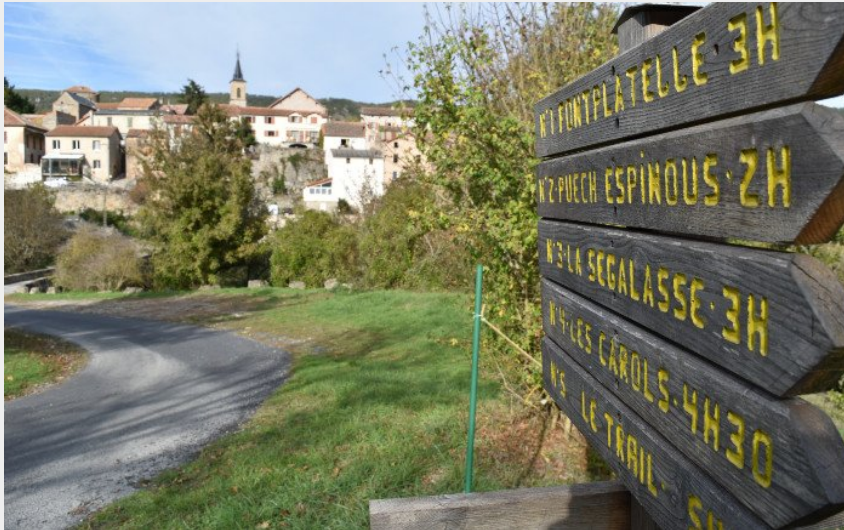
Au départ de Lapanouse