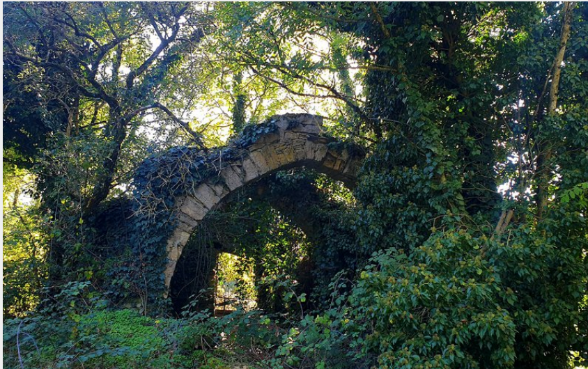
Le tour d'alzac