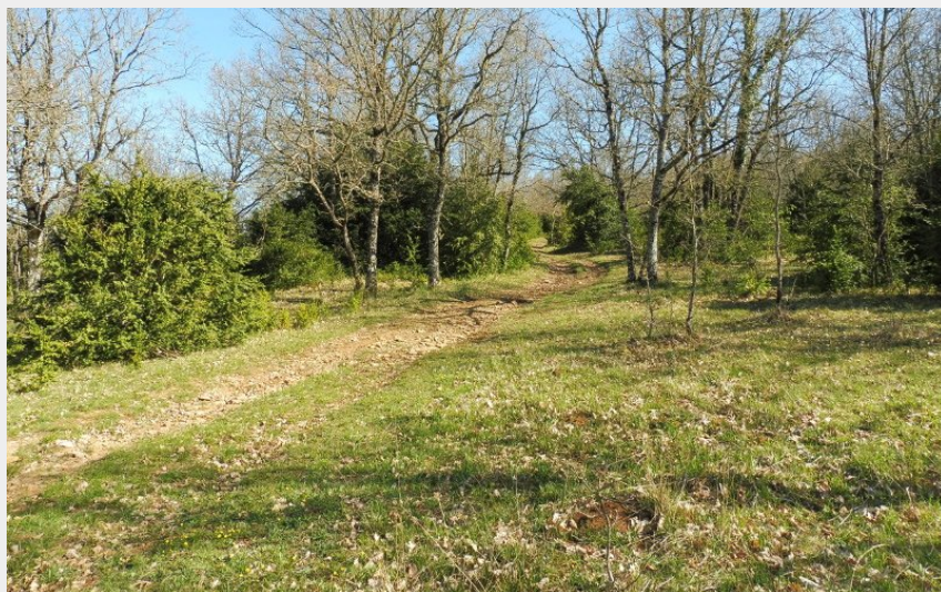
Sur le chemin... (SandrinePerego)