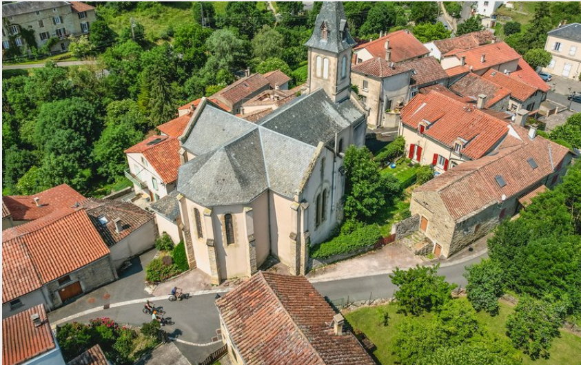
Saint-Jean d'Alcapiès (Roquefort Tourisme)