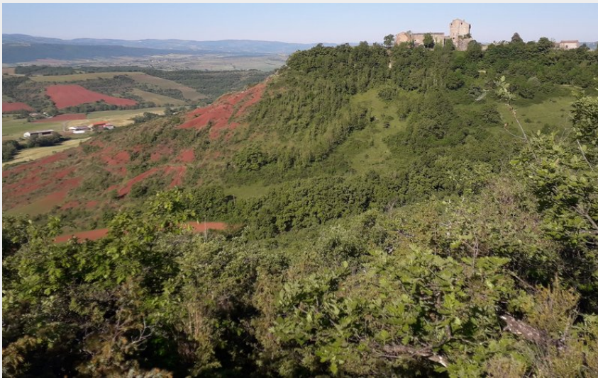
Rougiers & arrivée au château de Montaigut (Francis Puech)