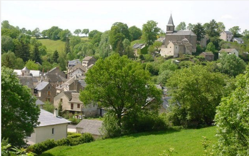
Séгур. Vue d'ensemble (ChristineRousseau)