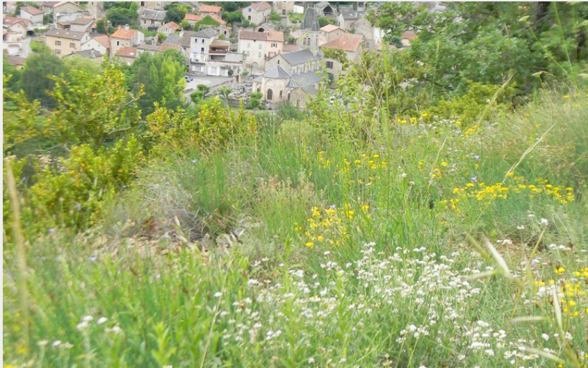
Village de Verrières (DavidBec)