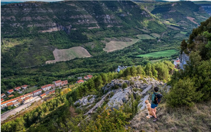
Les éboulis du Combalou (Virginie Govignon)