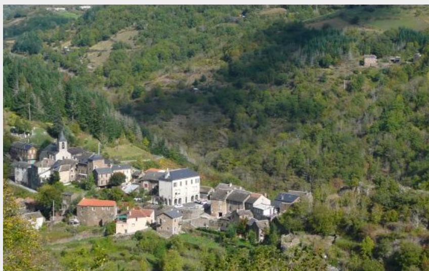
Ayssènes village (OT MUSE ET RASPES)