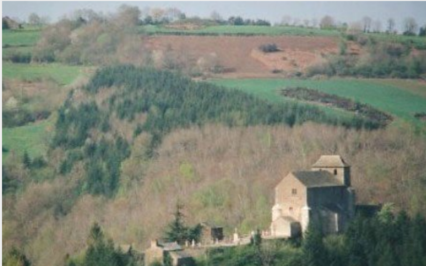
Vue sur St Georges (ChristineRousseau)